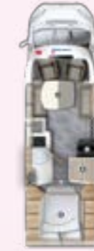
PRS 720 QF