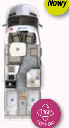
PT 696 EB