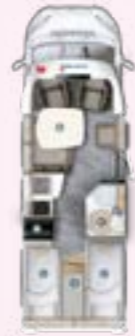
PRS 695 EB