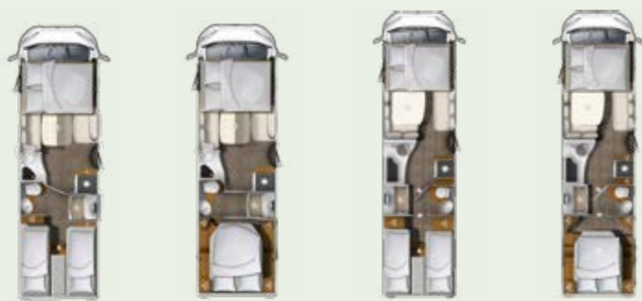
I 760 EF