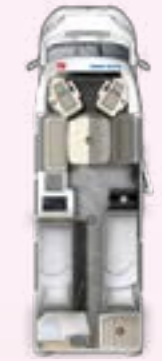
PT 730 EF