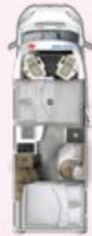
PRS 695 HB