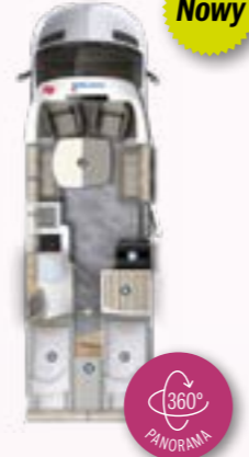
PT 726 EF