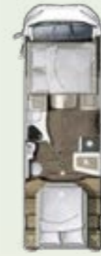
IL 720 QF