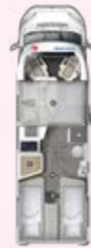
PRS 720 EB