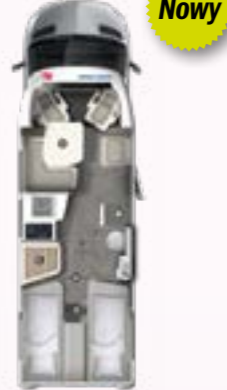
PT 726 EB