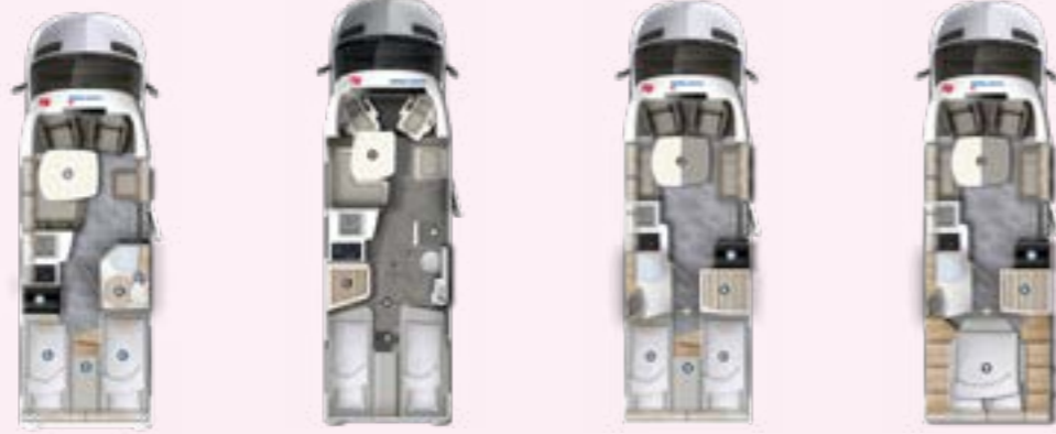
PT 696 EB