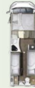
IL 730 EF