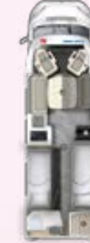
PRS 730 EF