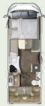
IL 695 LF