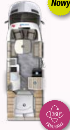
PT 726 QF