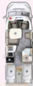
PT 695 EB