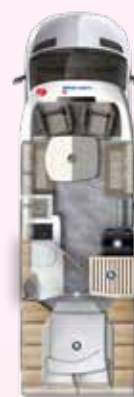
PT 726 QF