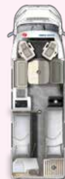
PT 730 EF