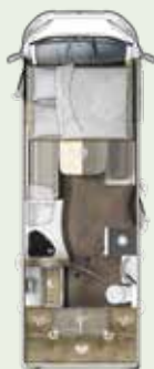
IL 695 LF