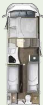
IL 730 EF