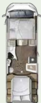
IL 720 QF