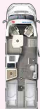
PT 720 EB