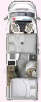
PRS 695 HB