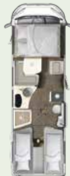
IL 720 EB