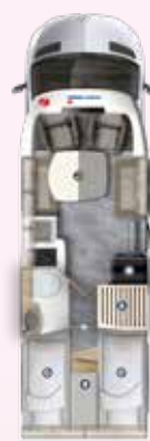
PT 726 EF