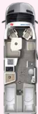
PT 726 EB