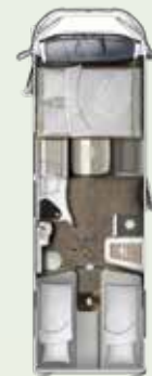
IL 720 EF