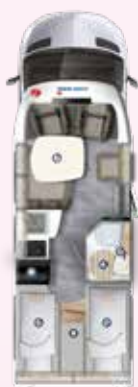
PT 696 EB