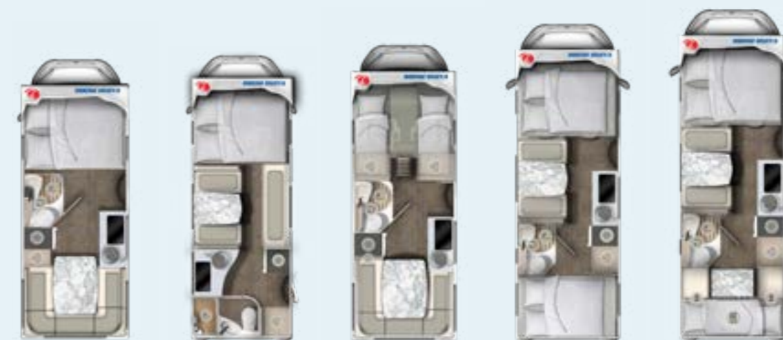
A ONE 570 HS A ONE 630 LS A ONE 650 HS A ONE 690 HB A ONE 690 VB