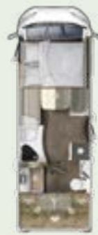
IL 695 LF