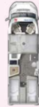
PRS 720 EB