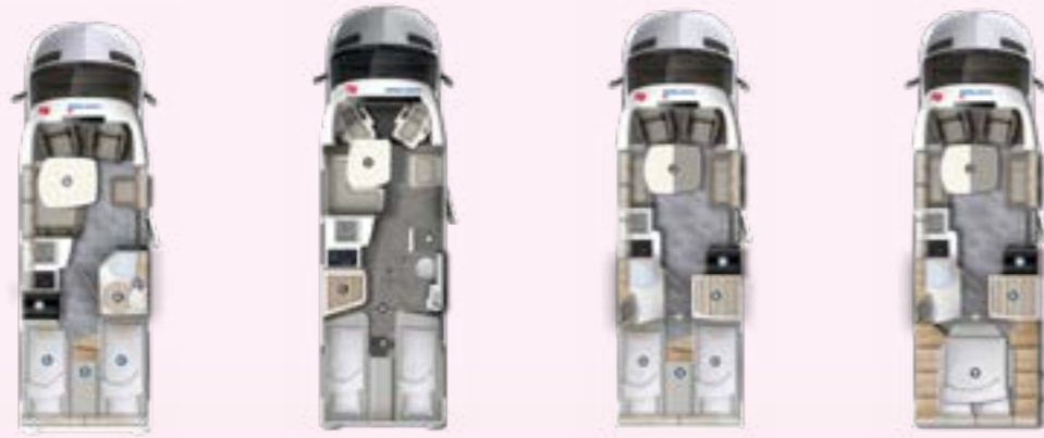
PT 696 EB