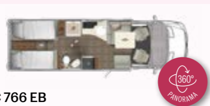
C 766 EB