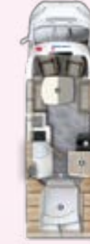
PRS 720 QF