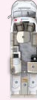
PRS 720 EF