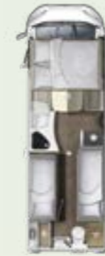
IL 730 EF