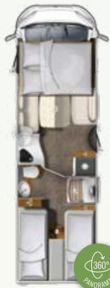
I 760 EF