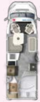
PT 675 SB