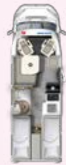
PT 660 EB