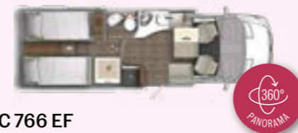
C 766 EF