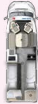
PT 730 EF