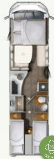
I 890 EB