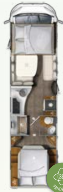
I 890 QB