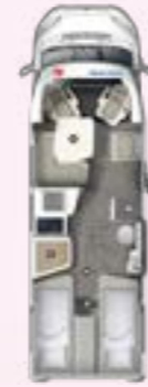
PT 720 EB