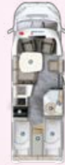
PT 695 EB