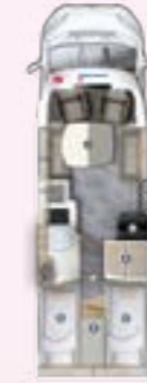
PT 720 EF