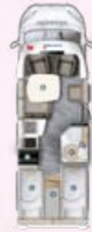
PRS 695 EB