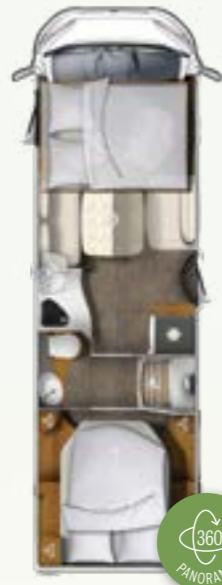
I 760 QF