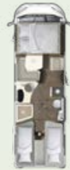
IL 720 EB