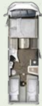
IL 720 EF