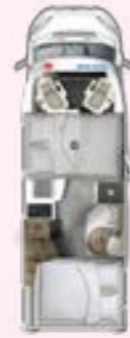
PRS 695 HB