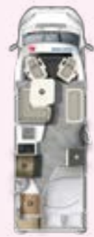
PRS 675 SB