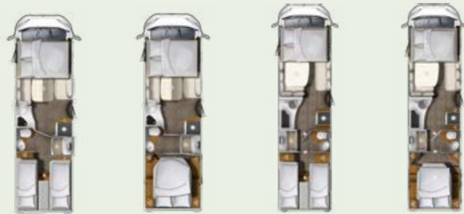
I 760 EF