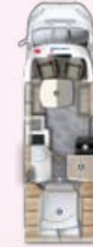
PT 720 QF