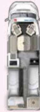
PRS 730 EF