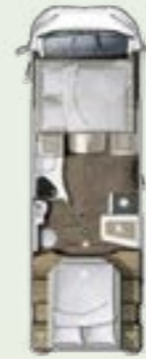
IL 720 QF