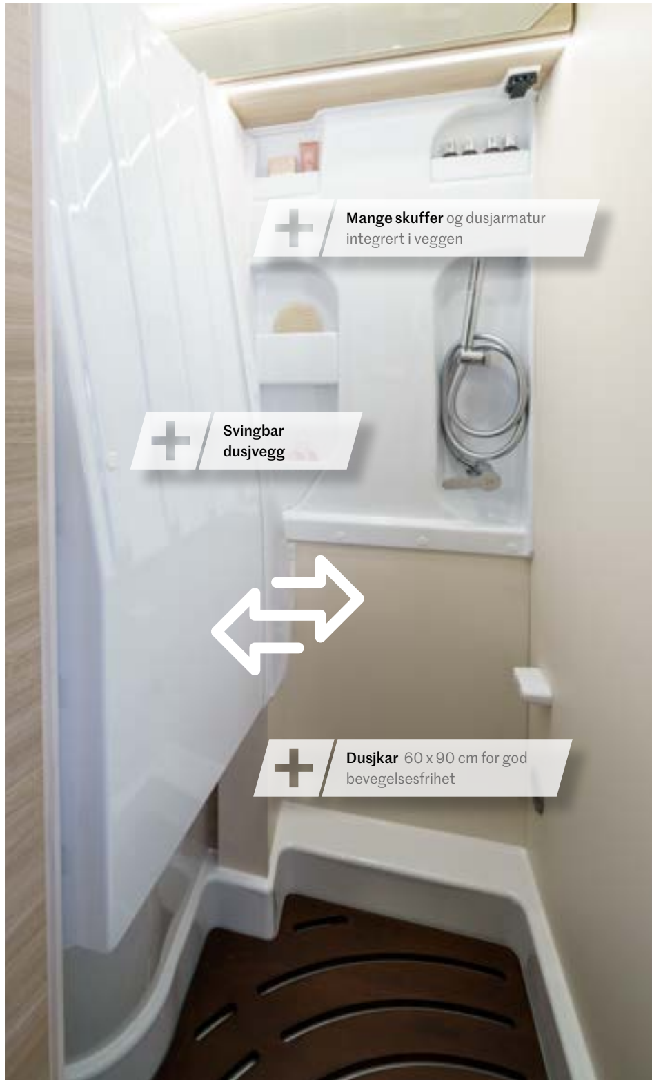
+ Mange skuffer og dusjarmatur integert i veggen