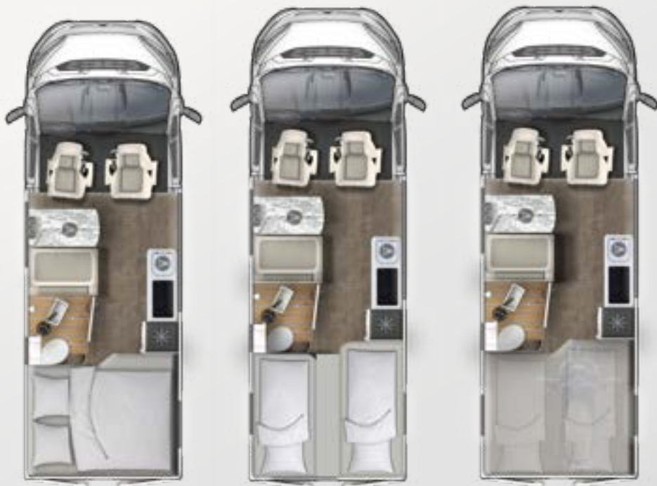
V 595 HB