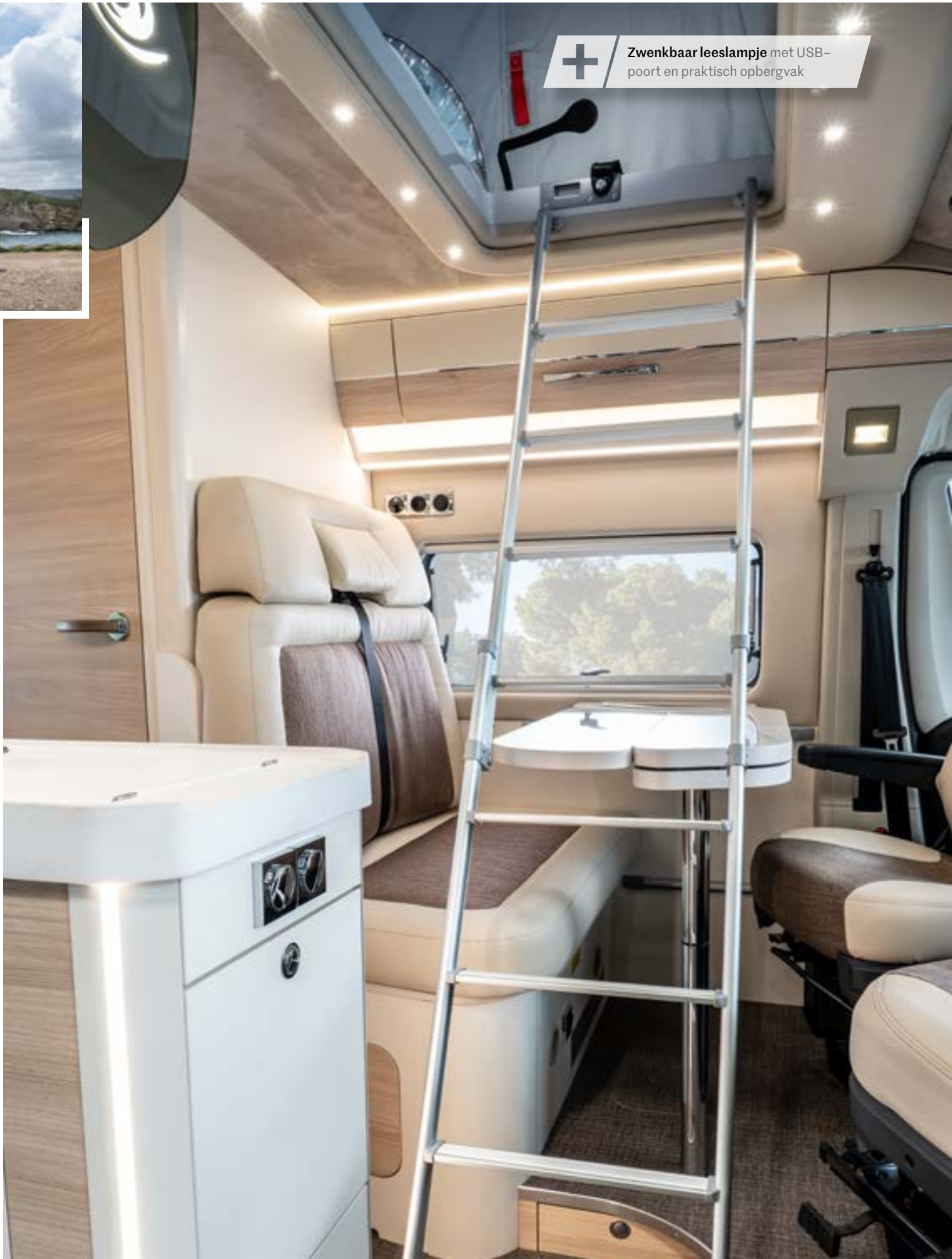
+ Zwenkbaar leeslampje met USB-poort en praktisch opbergvak