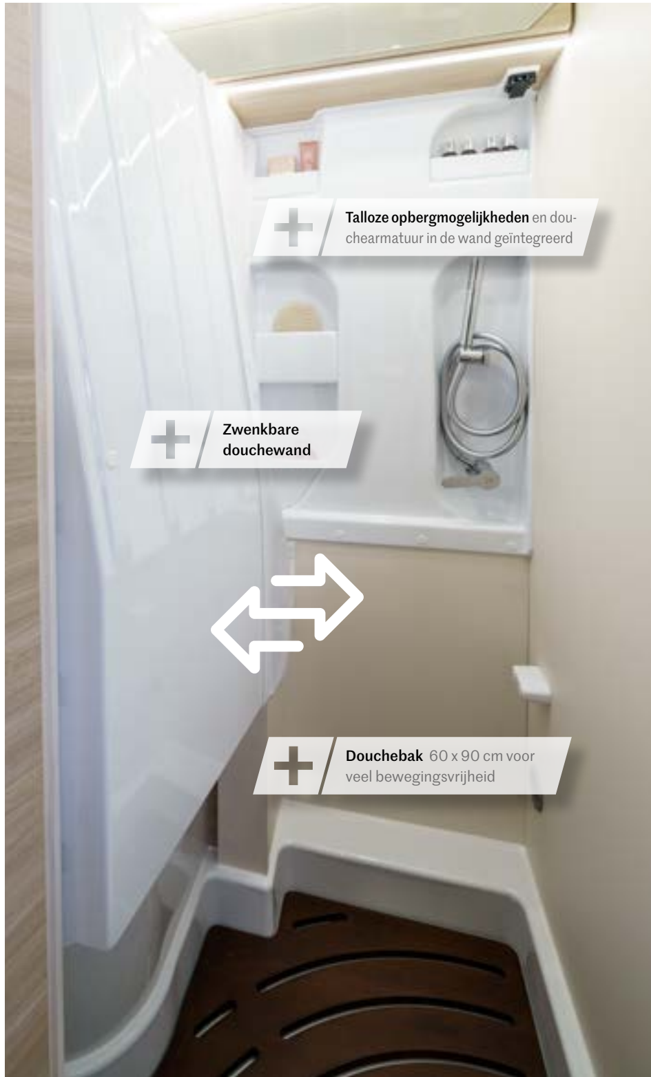
+ Talloze opbergmogelijkheden en douchearmatuur in de wand geïntegreerd