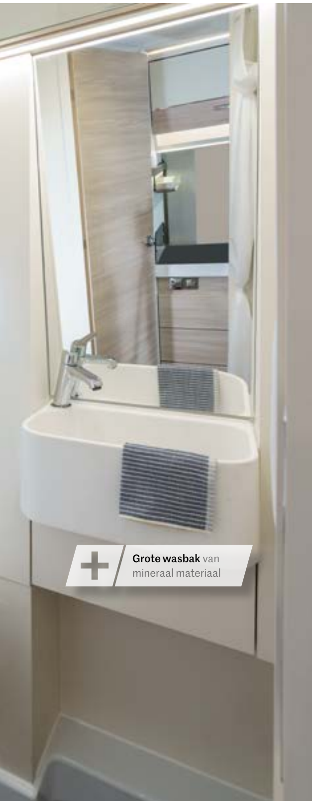
+ Grote wasbak van mineraal materiaal