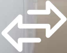
+ Douchebak 60 x 90 cm voor veel bewegingsvrijheid